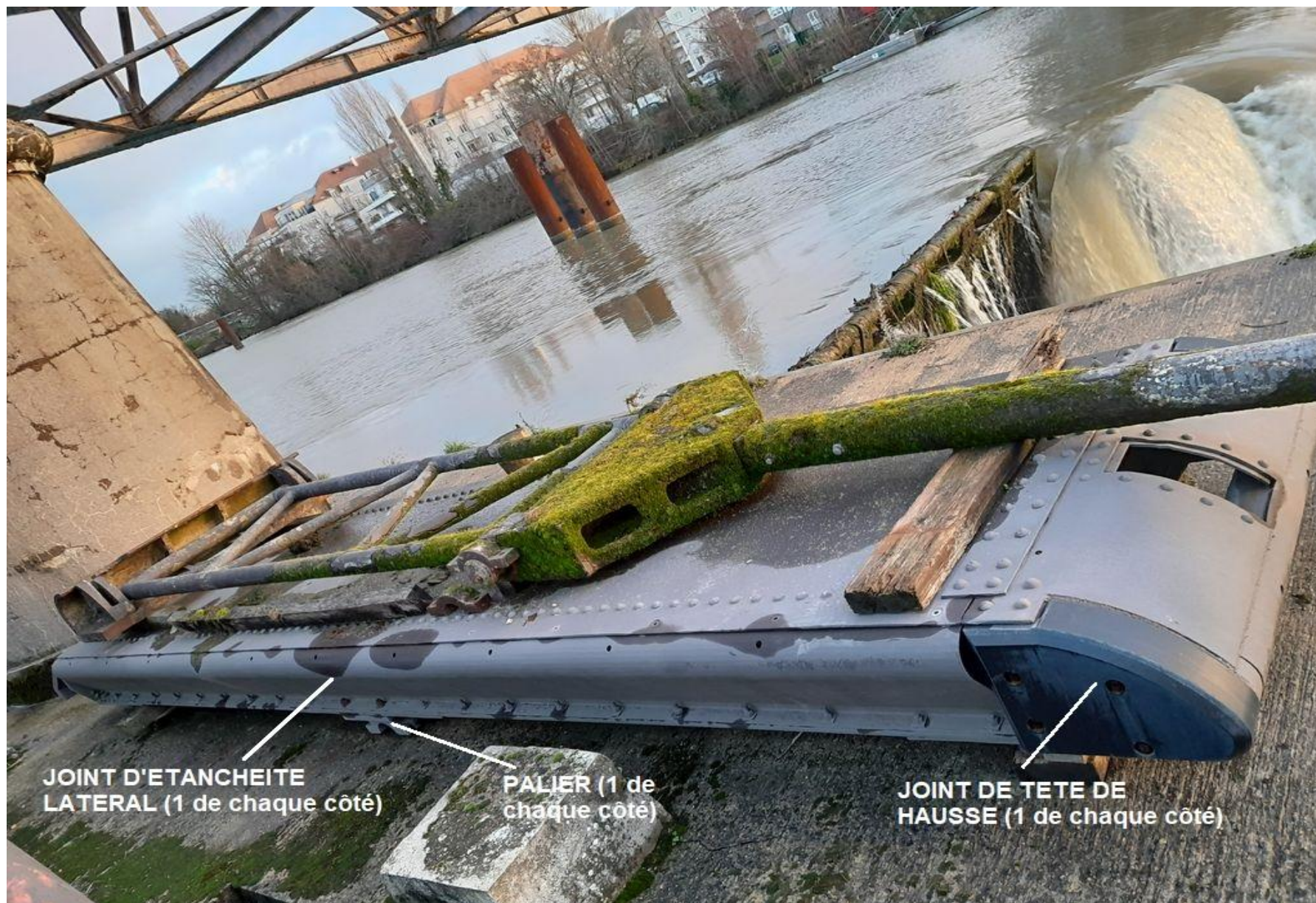
Panneau de hausse seul avec les éléments à remplacer